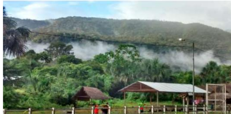
Ambición y Estrategia Climática del Gobierno Wampis